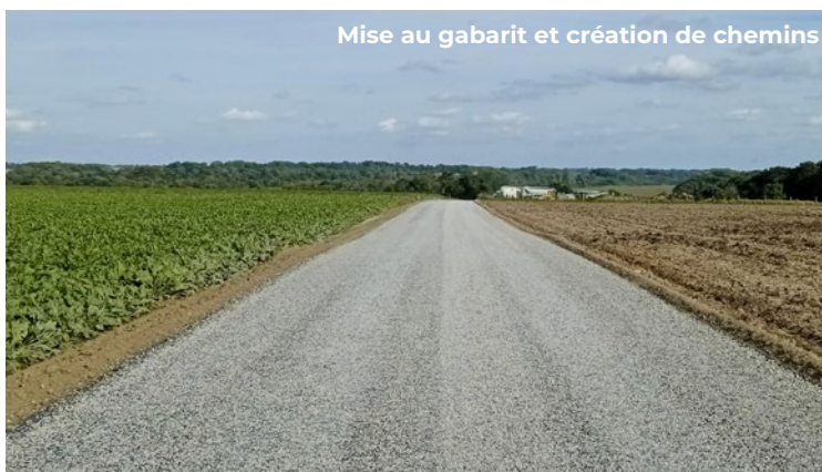
Mise au gabarit et création de chemins